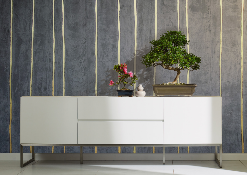
Bild oben: Veredelung mit Blattgold von Marburg/Horus. Unten: Handmade von Elitis/Trancoso; Pflanzen und Tiere von Rasch/Paspartout und von Cole & Son/Botanical (v. l. n. r.).

heute ist es dank Vliestapeten möglich, mit wenig Aufwand nach einigen Jahren das Motiv zu wechseln und neu zu tapézieren.