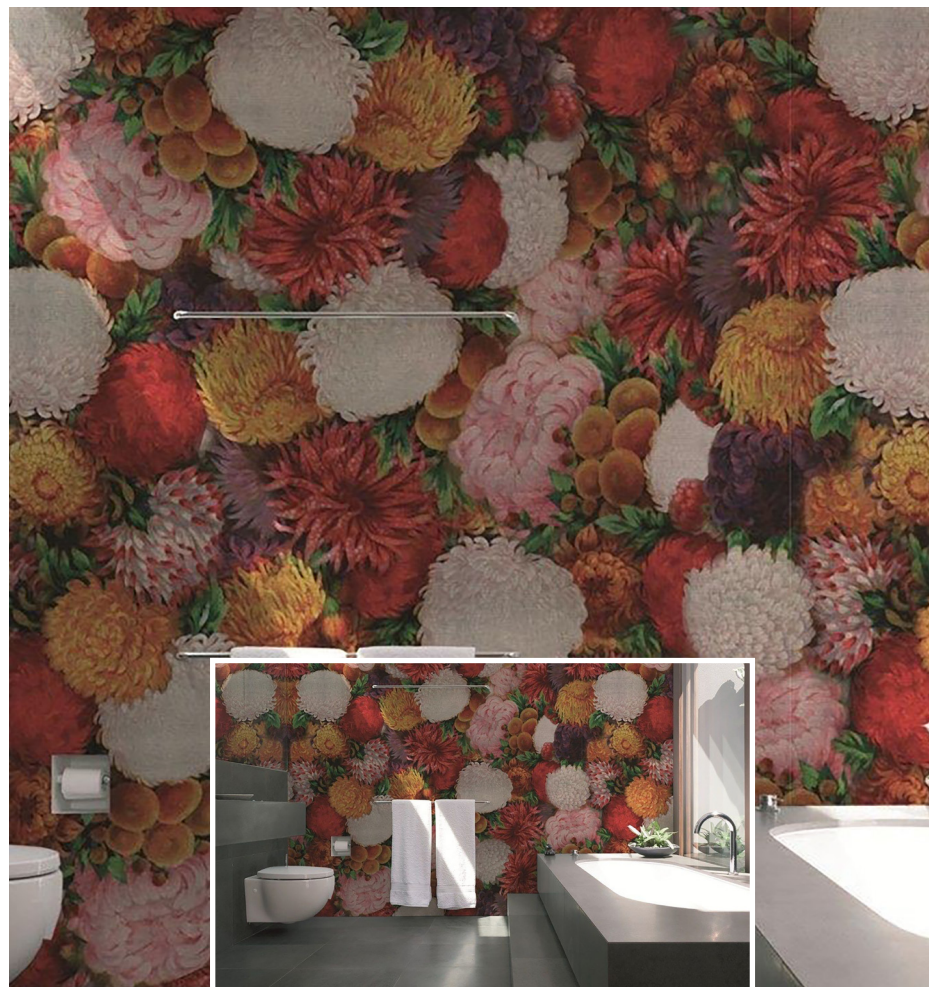
Tapeten für Nassräume von Wall and Deco/Wet System.

dezimmer oder Küchen können trotz erhöhter Luftfeuchtigkeit mit einem wasserdichten Tapetensystem versehen werden. Diese speziellen Tapeten halten den Anforderungen von Feuchträumen stand und ermöglichen das Tapezieren von Orten, die für traditionelle Tapeten bis anhin nicht geeignet waren. ■