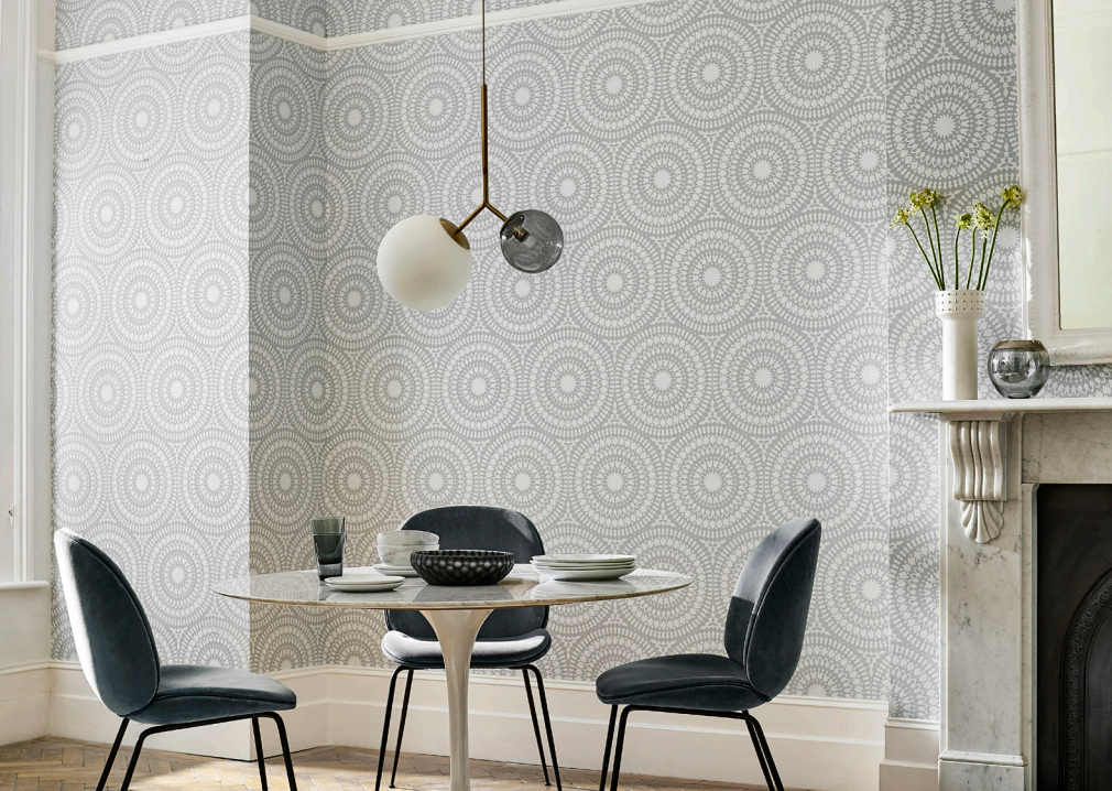
Skandinavisches Design von Harlequin/Paloma.

flächen wollen ertastet, gefühlt und gespürt werden. Oberflächenstrukturen aus Stroh, eingefärbtem Leinen, Muschelschalen, Perlmutter und recyceltem Teakholz sind in den neuen Kollektionen zu finden. Gefragt sind Handmade-Wandbekleidungen mit beziehungsweise aus nachhaltigen Materialien.