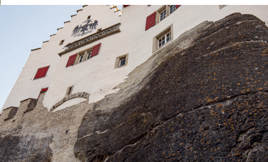
Oben: Die Landvogtei mit dem Adler der Habsburger, der früheren Besitzer des Schlosses.

Wechseln wir zur im Innenhof gelegenen Nordfassade des Ritterhauses. Sie weist im oberen Bereich einen Verputz aus der Bauphase um 1509 auf. Das ist eine der ältesten erhaltenen Putzflächen dieser Grösse im ganzen Kanton Aargau und deshalb besonders erhaltenswert. Aus diesem Grund entschied sich die Denkmalpflege, an dieser Fassade lediglich die Verputzschäden mit einer dem Bestand nachempfundenen Handmischung partiell in Stand stellen und mit Kalkfarbe a secco beschichten zu lassen. Solche wertvollen Materialien dürfen selbstverständlich nicht mit dem Hochdruckreiniger gereinigt wer-