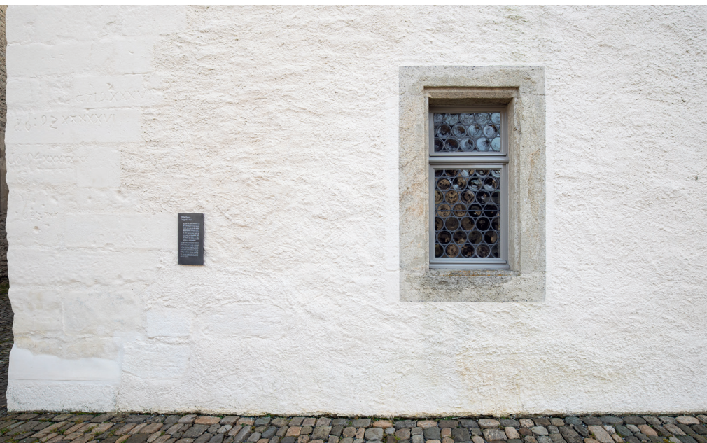
An der secco mit Kalk beschichteten Nordfassade zeigen sich die feuchten Stellen deutlich.

flächen gleichmässiger und damit «moderner» anmuten. Hier an Toranlage, nördlichem Bergfried, mittlerem Torhaus und der Nordfassade des Bernerhauses ist es windrichtungsbedingt schattig und besonders feucht. Beim Kalk hat die Verwitterung bereits nach einem halben Jahr wieder begonnen. An vorstehenden Stellen der Mauer blättert die Farbe ab. Diese beiden Phänomene sind wegen der besonderen Verhältnisse auch beim Reinsilikat festzustellen.