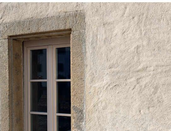
Typisches Bild eines Kalkputzes nach Verwitterung. Die Sandkörner treten hervor.

den, denn das würde sie zerstören. «Wir gingen sehr vorsichtig vor mit Wasser und Bürste», berichtet Leuzinger, teilweise hätten sie den Verputz mit einem Fixativ gefestigt.